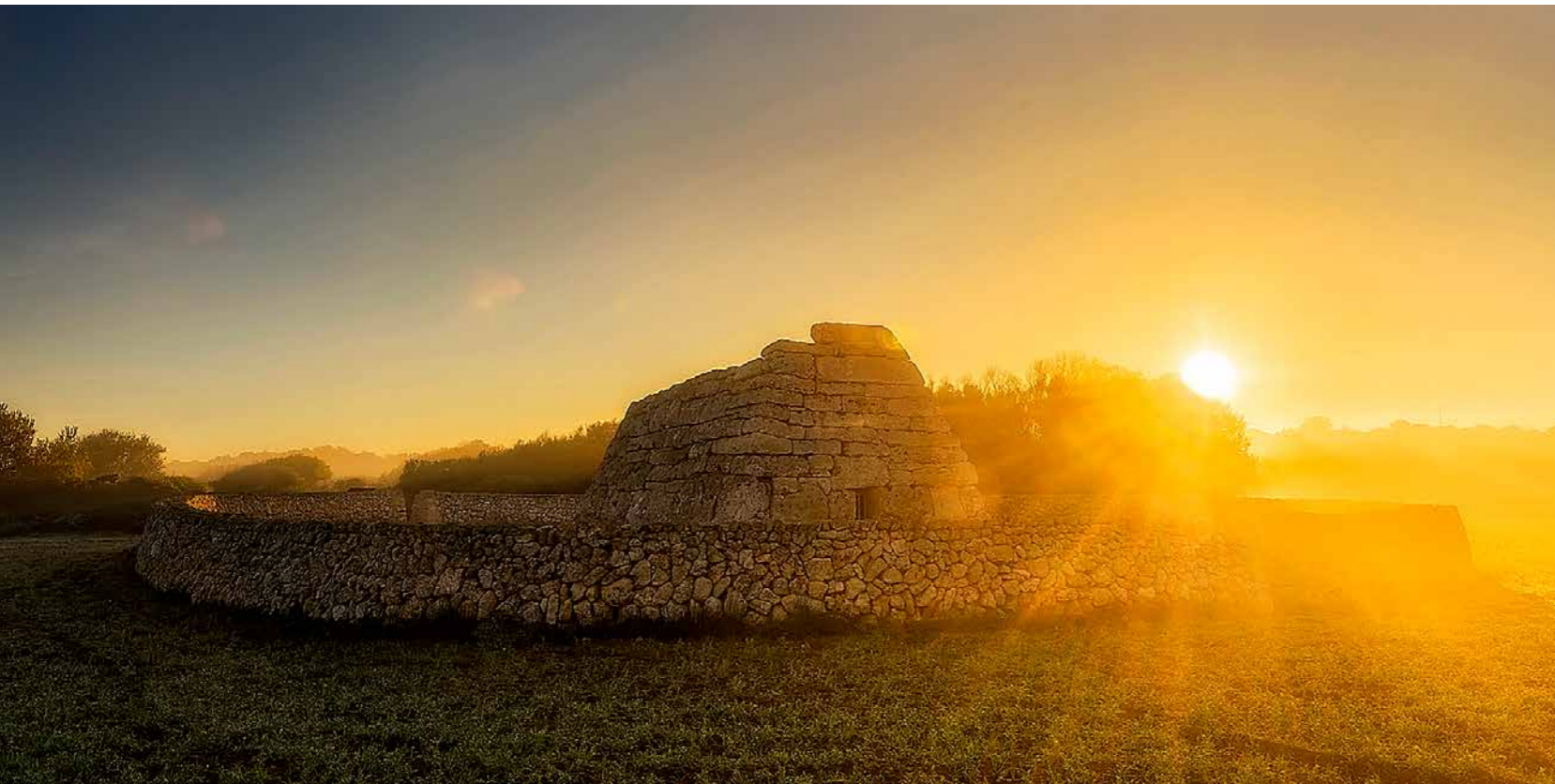
La cova 5 de la necròpolis de Cala Morell va ser usada com a cisterna pels pagesos fa dos o tres segles, quua van tapiar-ne l'entrada i obriren un forat al sostre, visible a la fotografia. A la dreta, una de les navetes funeràries des Rafal Rubí. A l'esquerra, la icònica naveta des Tudons. A dalt, a l'esquerra, el dolmen de ses Roques Llises.