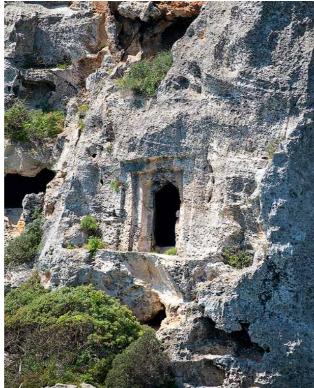
Calescoves és una de les necròpolis més populars de Menorca. S'hi han inventariat unes noranta coves de diferents tipologies i èpoques. A baix una bassa de Coll de Cala Morell.

COVES MURADES Coves naturals a les quals s'afegeix un mur de tancament ciclopí amb un portal d'accés al centre, com la cova des Càrritx. ◀