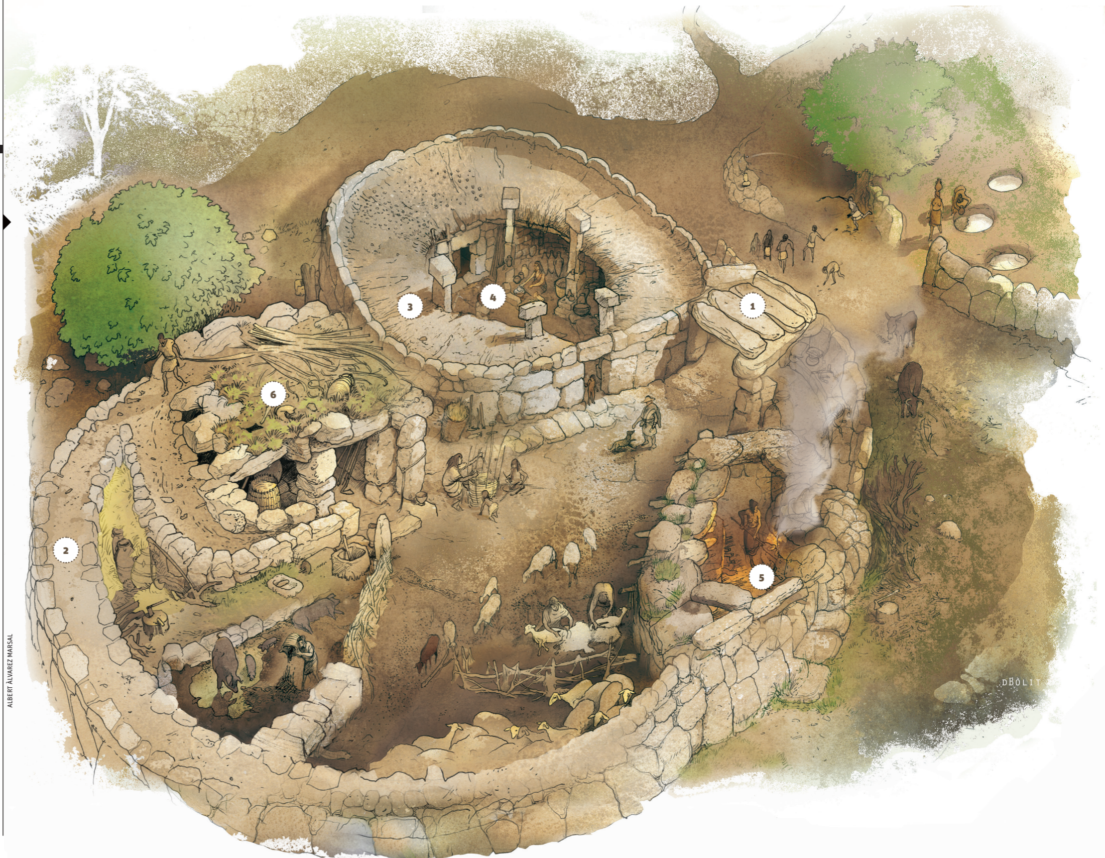
ALBERT ÀLVAREZ MARSAL

Són habitatges de grans dimensions (més de 100 m 2 ) propis de la fase final de la cultura talaiòtica. Presenten una única entrada, orientada al sud, que dona accés a un pati central. Al voltant d'aquest pati s'obren les portes que donen pas a les diferents habitacions. Són edificis molt monumentals, construïts amb tècnica ciclòpia, en què destaquen les columnes monolítiques disposades al voltant del pati. A Torre d'en Galmés hi ha molts i bons exemples de cases amb pati central, i just al costat de l'aeroport també se'n pot visitar una. ◀