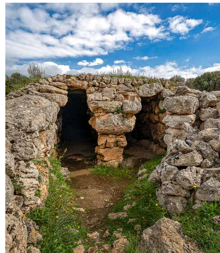
La cova des Moro és una de les navetes d'habitació que hi ha a Son Mercer de Baix. Durant un temps es va creure que era una naveta funerària, però excavacions posteriors han aclarit que era un habitatge. A l'esquerra, una foto magnètica de la lluna plena sobre una roca que té forma d'elefant, a cala Morell.

Cap al 1450 aC, coincidint en el temps amb les navetes i les protonavetes, algunes de les coves naturals que trobem als barrancs de Menorca es convertiren en espais funeraris. Les anomenem coves murades perquè l'entrada es tancava amb un mur ciclopi, deixant-hi un portal d'accés.